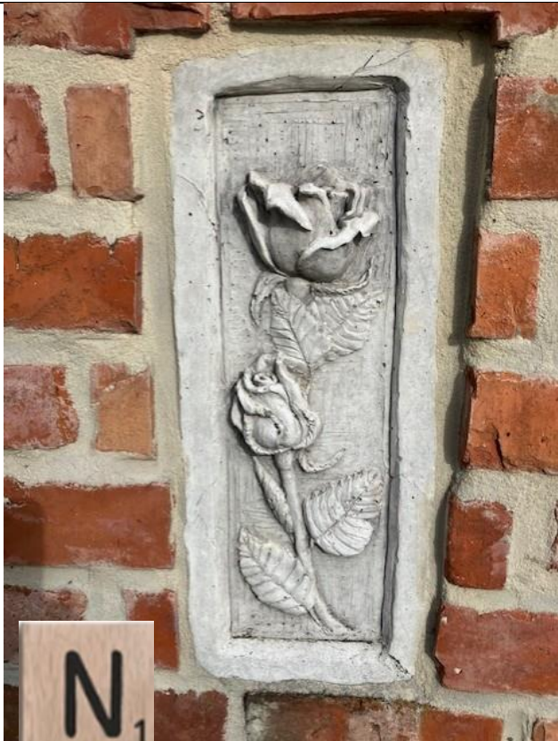
Tussen knooppunt ..... en .....