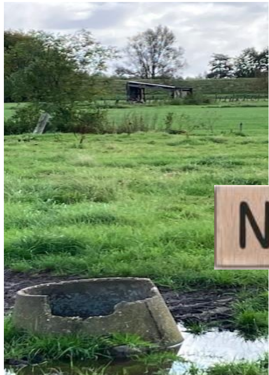
Tussen knooppunt ..... en .....