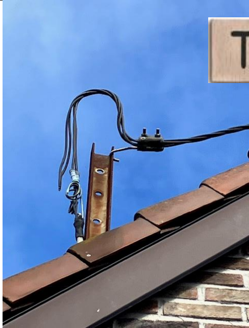
Tussen knooppunt .... en ....