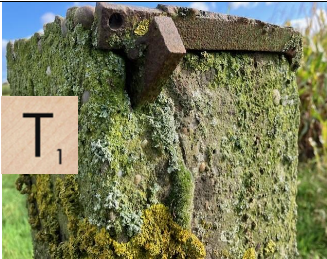
Tussen knooppunt ..... en .....