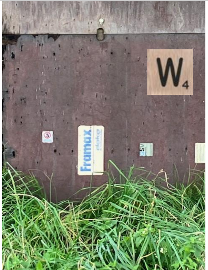
Tussen knooppunt ..... en .....