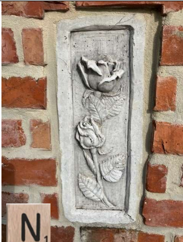
Tussen knooppunt ..... en .....