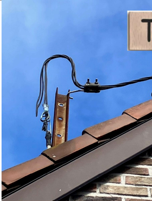
Tussen knooppunt .... en ....